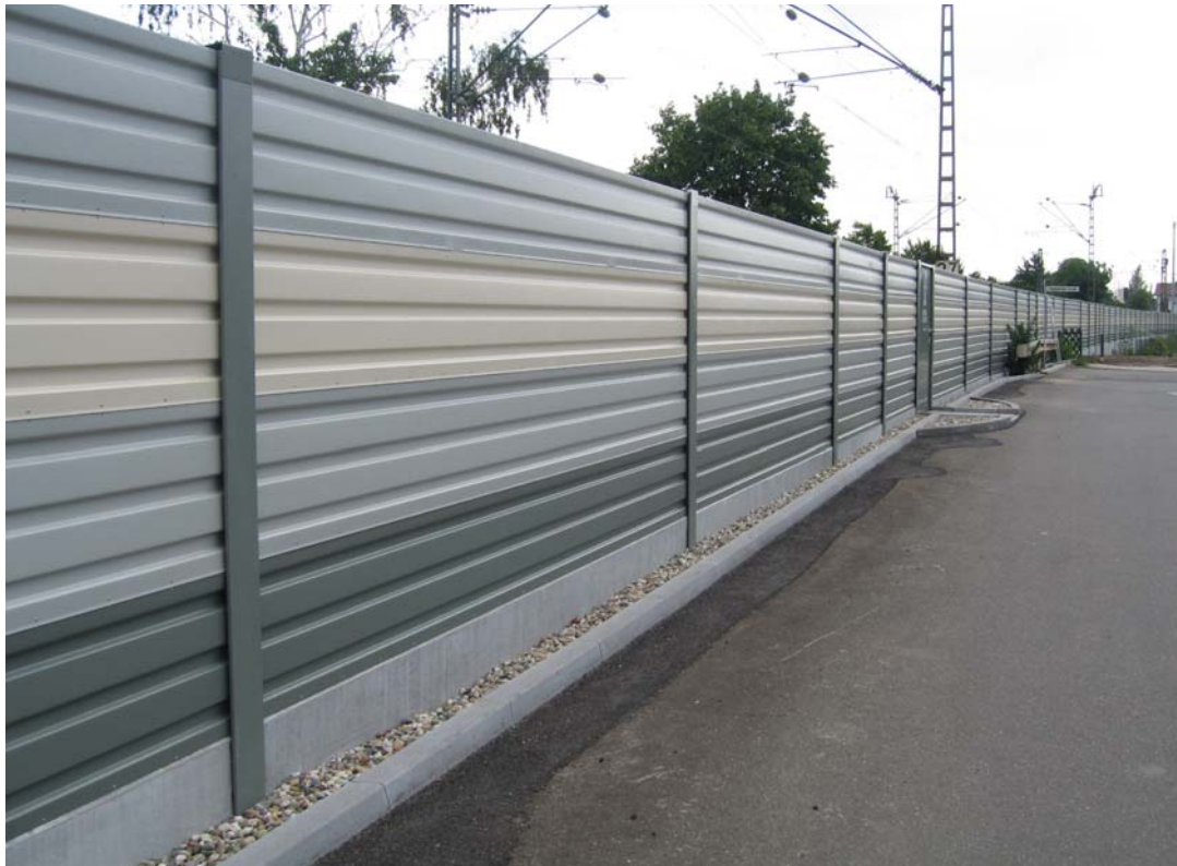
Farbvorschlag für die Lärmschutzwände in Kornwestheim